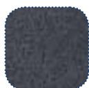
Preto plush TR35