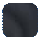
Preto Dartex TR26