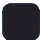
Preto spacer TR36

Rea, design Rea e DSS (Dual Stability System) são marcas registadas da Invacare Internacional. A Rea Azalea tem integrado o DSS que proporciona ao utilizador mais estabilidade e segurança quando bascula e reclina a cadeira.