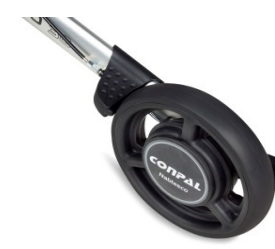
// 9009329 (2) Rodas SpeedControl

(1) Não disponível para Geminos 60 M/60 M Walker. (2) Não disponível para Geminos 60 / 60 M e Gemino 60 Walker/60 M Walker.