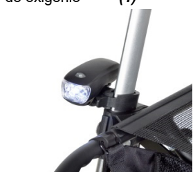
// 7109095 Luz