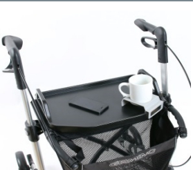
// 7109140 Mesa -bandeja