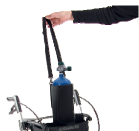
// 7109050 & 7109051 Suporte para garrafas de oxigénio (1)