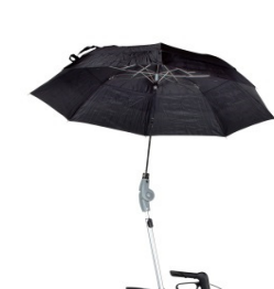
// 7109060 Chapéu de Chuva em preto