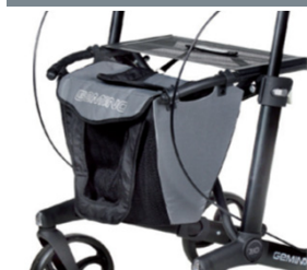
// 7104025 (1) Cinzena / preta