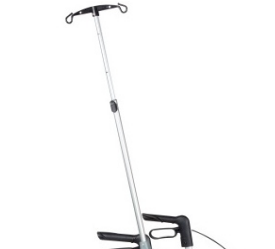
// 7109100 Suporte de soro