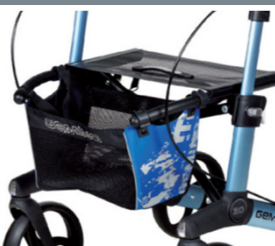
// 7104032 Bolsa estampada azul/preto