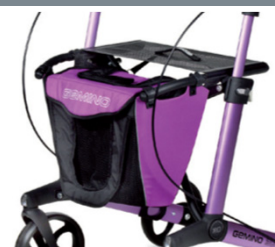
// 7104023 (1) Violeta/preta