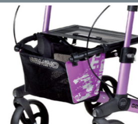
// 7104033 Bolsa estampada violeta/preto