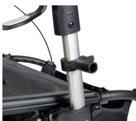
// 7109090 Braçadeira universal