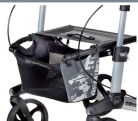
// 7104035 Bolsa estampada cinz./preta