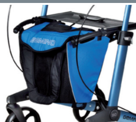
// 7104022 (1) Azul/preta