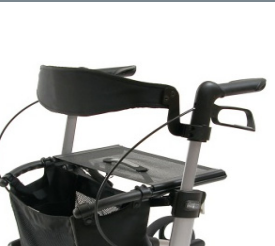
// 7109020 & 7109021 Encosto (2) (3)