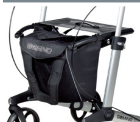
// 7104006 (1) & 7104007 Bolsa Advance com tampa e pegas preta