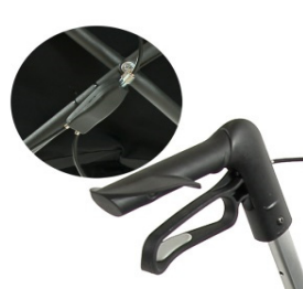
// 7109071 (2) Travão de uma só mão