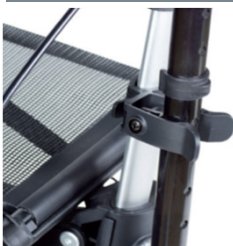
// 7109011 Suporte de canadianas