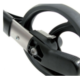
// 7109080 Travão de desaceleração