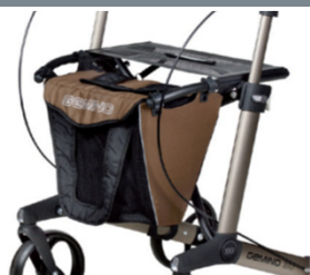
// 7104024 (1) Castanha / preta