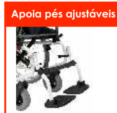
Apoia pés ajustáveis