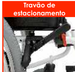
Travão de estacionamento