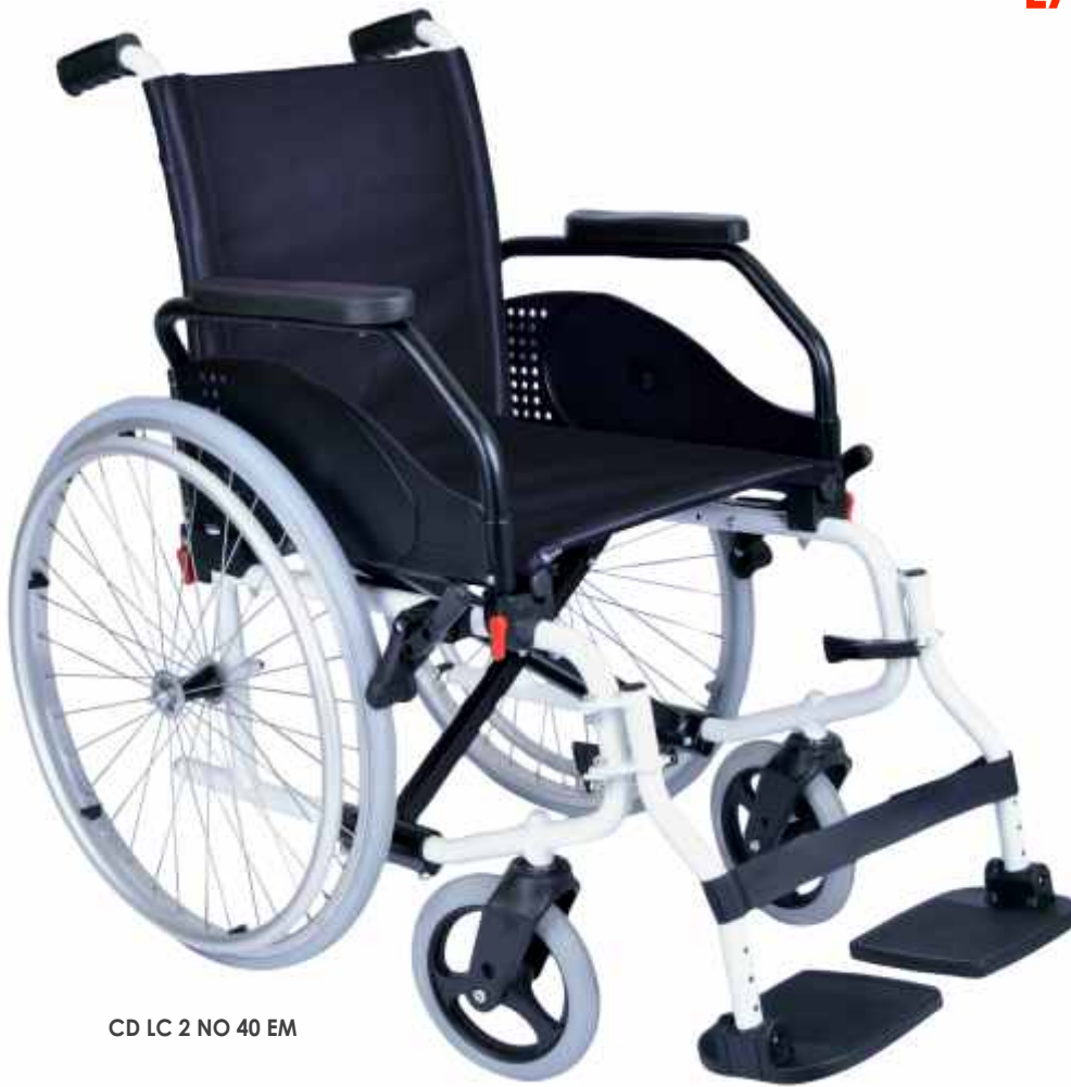
CD LC 2 NO 40 EM

LATINA COMPACT, cadeira em alumínio com cruzeta tripla compacta e leve. Estrutura branca e estofos em preto Opção de cores: púrpura, pistáchio, verde escuro e creme (custo adicional). Apoia braços abatíveis e apoia pés ajustáveis em altura e destacáveis. Em 3 tamanhos, com rodas Ø600mm com sistema de quick release ou Ø300mm (trânsito).