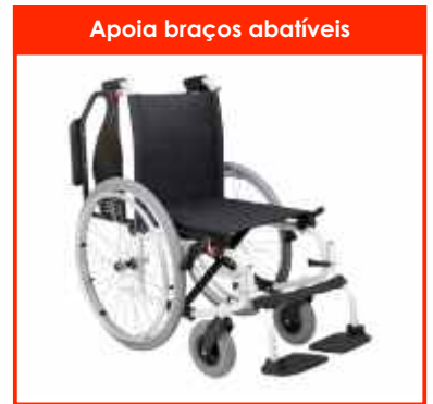
Apoia braços abatíveis

LATINA COMPACT, cadeira em alumínio com cruzeta tripla compacta e leve. Estrutura branca e estofos em preto Opção de cores: púrpura, pistáchio, verde escuro e creme (custo adicional). Apoia braços abatíveis e apoia pés ajustáveis em altura e destacáveis. Em 3 tamanhos, com rodas Ø600mm com sistema de quick release ou Ø300mm (trânsito).