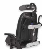
Vista posterior do Encosto Flex 3 com encosto reclinável elect.