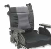
2111 +2142 +2171