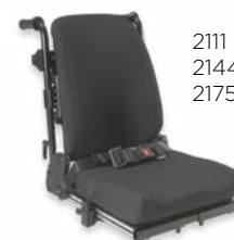
2111 + 2144 + 2175