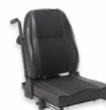
2111 + 2142 + 2173 + 2153